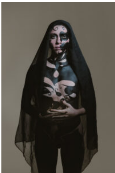
Idea/Body Art/Progetto di Monica Argentino