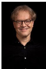
il Maestro Ludwig Wicki

Musicato dal vivo dall'eccellente Orchestra Italiana del Cinema , diretta per questo secondo evento della rassegna dal Maestro Ludwig Wicki , il primo episodio della saga dei pirati diretto da Gore Verbinski è dunque tornato, proiettato in alta risoluzione, per due giorni sul grande schermo, circondato da un'atmosfera festosa e divertita; all'interno dell'Auditorium, parte dei musicisti ha eseguito pillole della colonna sonora per gli ospiti in attesa di entrare in sala, mentre un cosplayer di Jack Sparrow si aggirava, disponibile per una fan-foto con il pirata più amato da tutti.