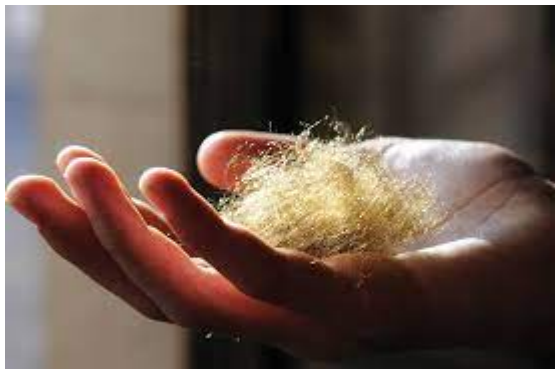
"Il filo dell'acqua" di Rossana Cingolani

Menzioni speciali del Concorso Documentari