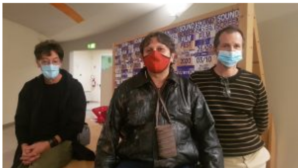
Presentazione de “La macchia mongolica” a Ravenna