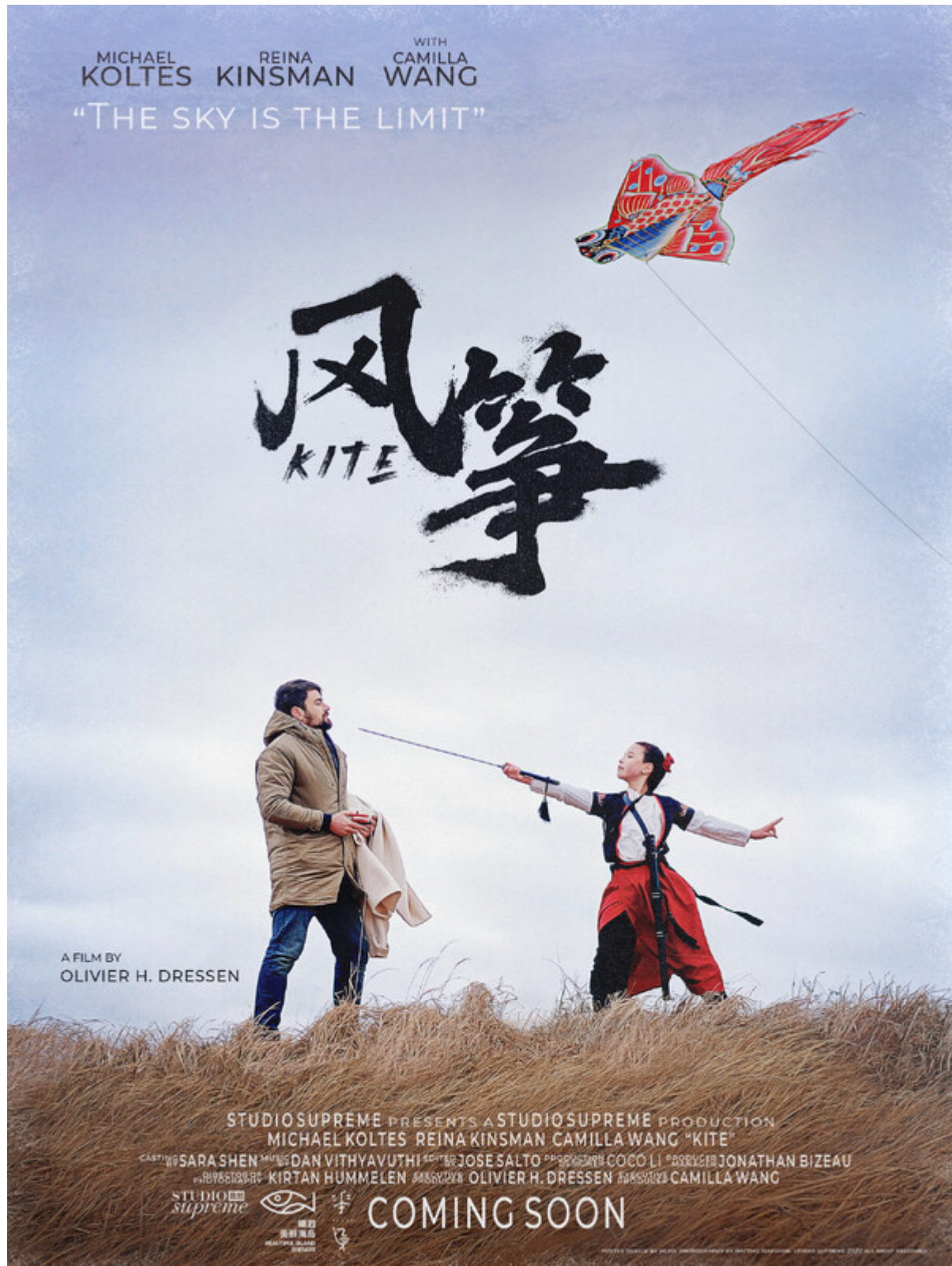
Kite ("L'aquilone") di Olivier Hero Dressen (Cina 2023, 15?)