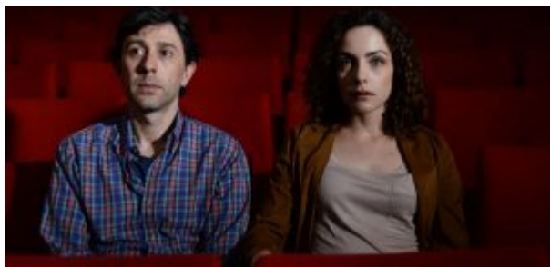
“La macchina umana”