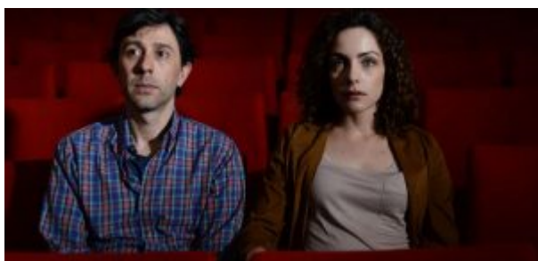
“La macchina umana”